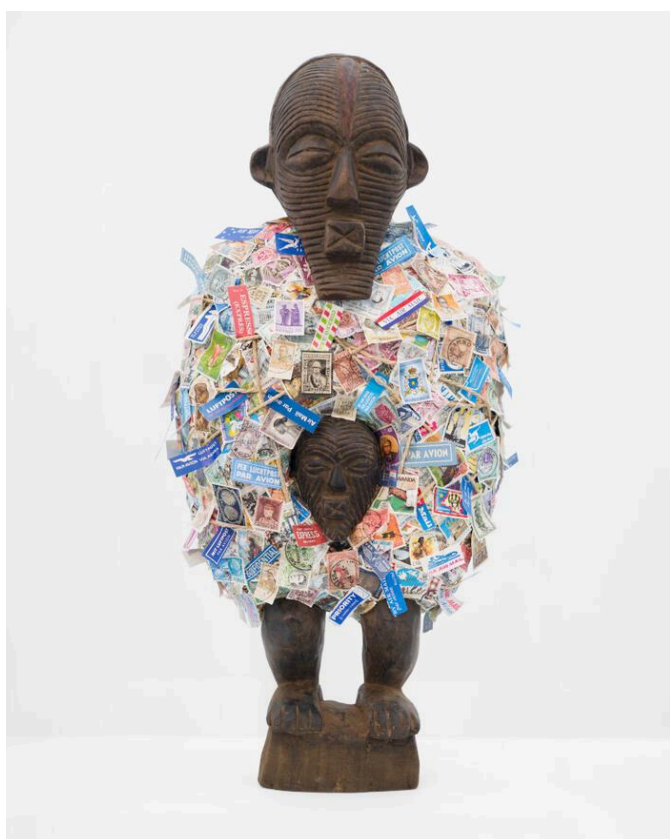
Maarten Vanden Eynde, Return

Veel details over de oorsprong van het beeld en de inbeslagname blijven in nevelen gehuld. Maar zelfs als die inbeslagname de koloniale wetgeving volgde, kan hier alleen maar sprake zijn van een gedwongen overhandiging. Voor het MAS bestaat er dan ook geen twijfel: dit is roofterkunst. De onderzoekers rekenen daarbij niet enkel strikte roof tot 'onrechtmatige verwerving': in een context van structurele ongelijkheid kan ook een verkoop of schenking gekenmerkt worden door dwang.